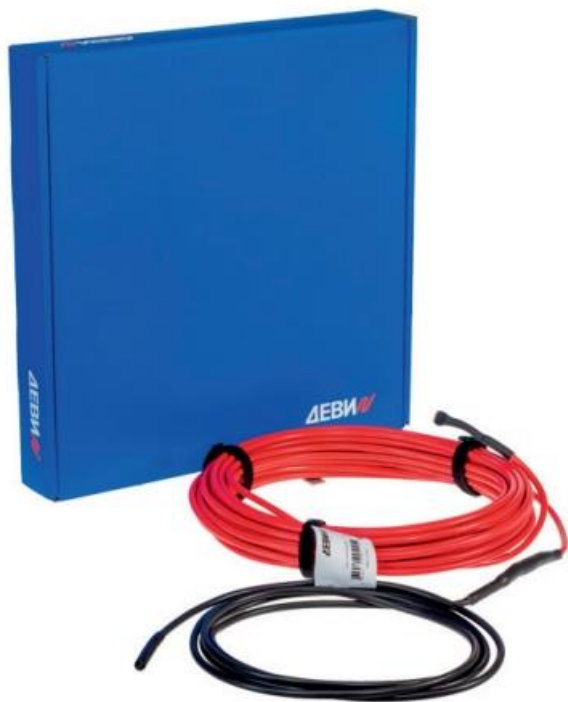
Рис. 1. Внешний вид нагревательного кабеля ДЕВИ Flex-18Т .