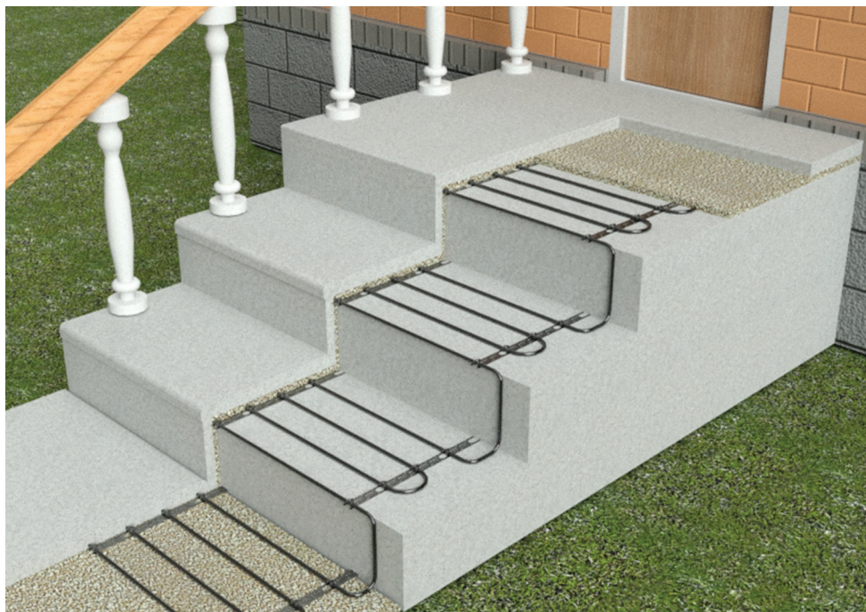
Рис. 3. Обогрев ступеней на крыльце

При монтаже кабелей на ступенях (входные группы) необходимо учитывать дополнительную площадь теплоотдачи. В этом случае рекомендуется перейти на шаг укладки кабеля 7,5 см (на ступени стандартной ширины 300 мм монтируется четыре нитки кабеля). Кроме того необходимо при монтаже сдвигать крайнюю нитку кабеля на самый край бетонной заготовки для лучшего прогрева края ступени, см. рис. 3.